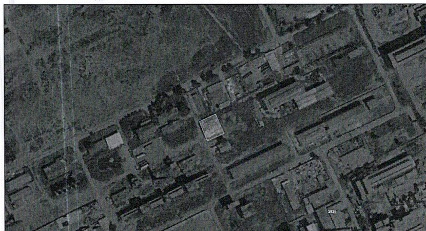
Plani i Përgjithshëm Vendor i Bashkisë Elbasan / Shoqëria "POENIA-GROUP" sh.p.k

2/10/2023, 11:40:45 PM Njësi Strukturore IE Industri Ekonomi