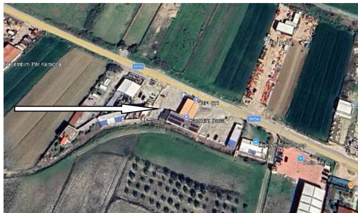
Pamje e vendosjes se aktivitetit

Siperfaqia totale e sheshit ku zhvillohet aktiviteti 800 m2