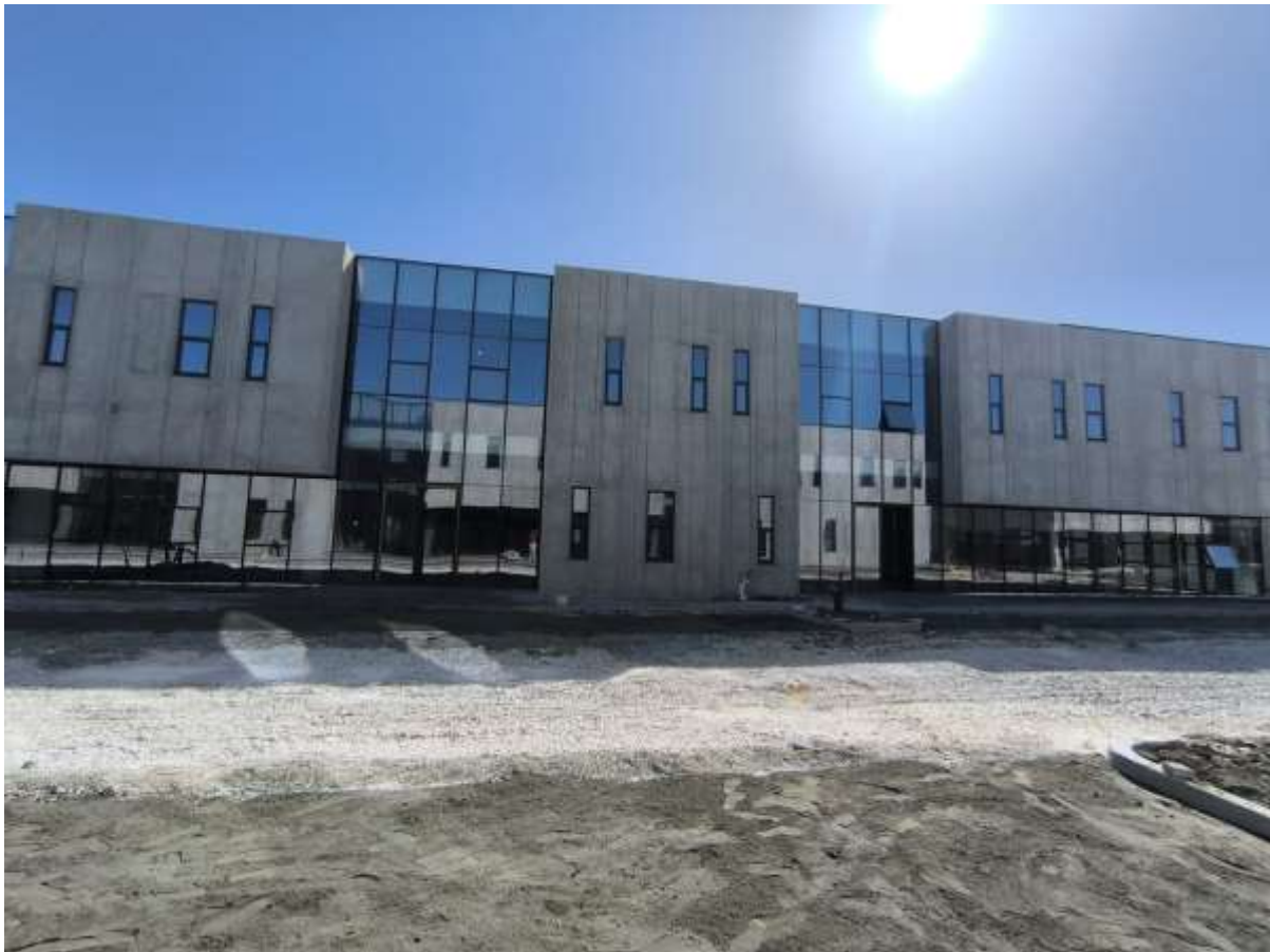
Figura 3.Pamje ne pjesen perpara godines.

Ne fotot e meposhtme jepen disa pamje te cilat ndodhen ne afersi te subjektit :