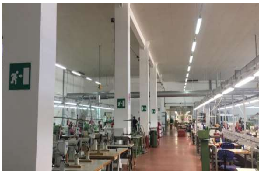
Figura 6. Pamje e sigurimit te kushteve optimale ne mjedise pune

Alban Del ka krijuar kushtet me te mira te ushtrimit te aktivitetit. Magazina ka nje hapesine te konsiderueshme nga dyshemeja ne tavan gje qe siguron mjedisin e domosdoshem per cdo punonjes, ventilimin e mjediseve te punes dhe ndricimin e duhur.