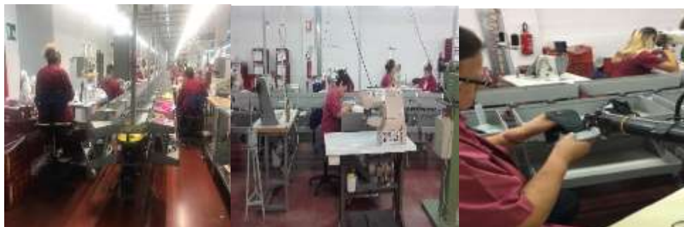
Figura 7: Pamje nga procesi i bashkimit dhe qepjes se copave.

Pasi eshte konfirmuar cilesia e prerjeve te pjeseve te vecanta ato i nenshtrohen bashkimit te copave dhe me pas qepen. Procesi i qepjes kalon dore me dore, pra cdo punonjes eshte pergjegjes per qepjen e nje pjese te caktuar per te formuar kepuccen, atleten apo edhe sandalen. Procesi eshte shprehur me ane te figurave si me poshte.