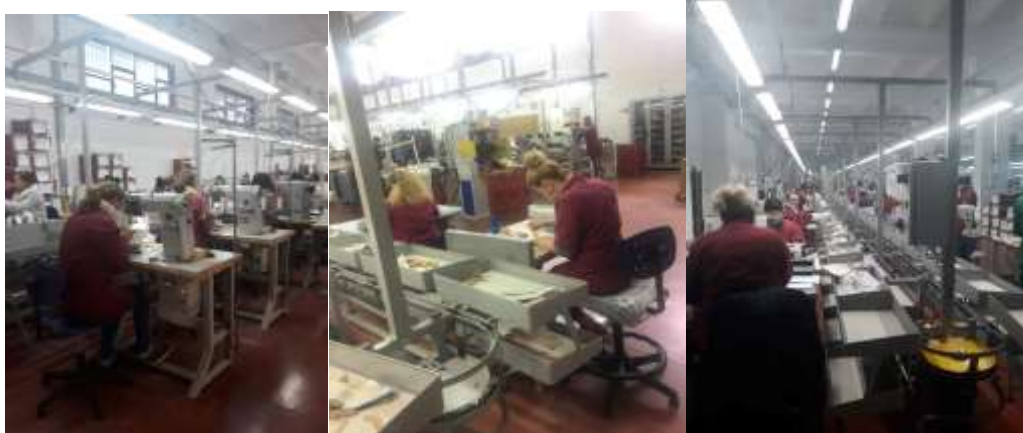
Figura 5. Pamje e zonave te punes

Metodat: Per percaktimin e metodave me te mira te ushtrimit te aktivitetit ekonomik subjekti ALBAN.DEL shpk ka implementuar eksperiencen e meparshme te kompanise Tod's International B.V.