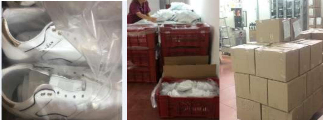
Figura 8: Kontrolli dhe paketimi i produktit te perftuar