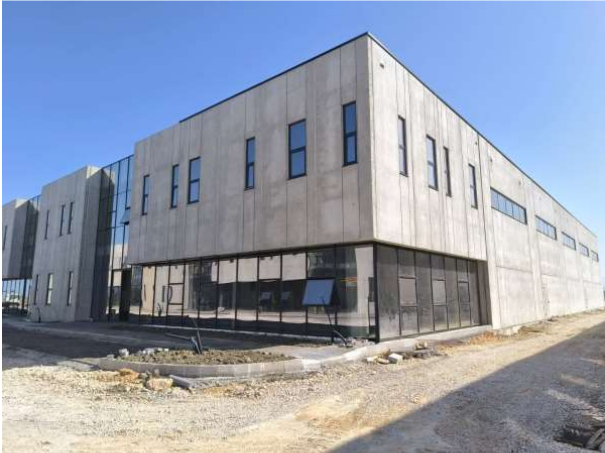
Figura 4.Pamje e pjeses anesore e cila perkon me mjediset e parkimit

Ne paragrafet e meposhtem do te pershkruhen ndikimet e mundshme qe aktiviteti mund te kete kryesisht gjate funksionimit te tij ekonomik.