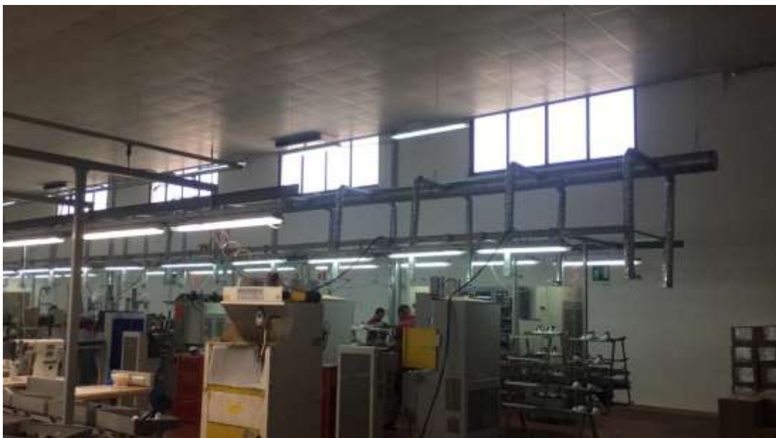
Figura 9. Pamje e mjediseve te brendshmeve te fasonerise