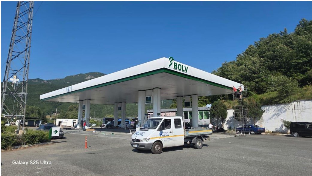
Galaxy S25 Ultra