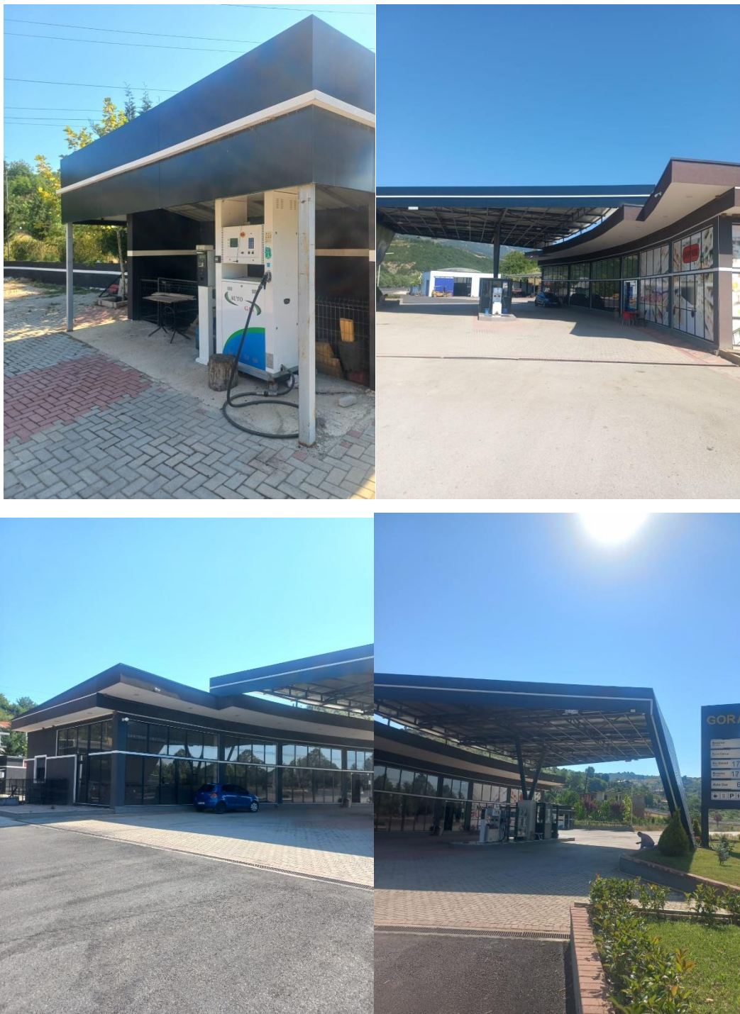
FOTO TE AKTIVITETIT