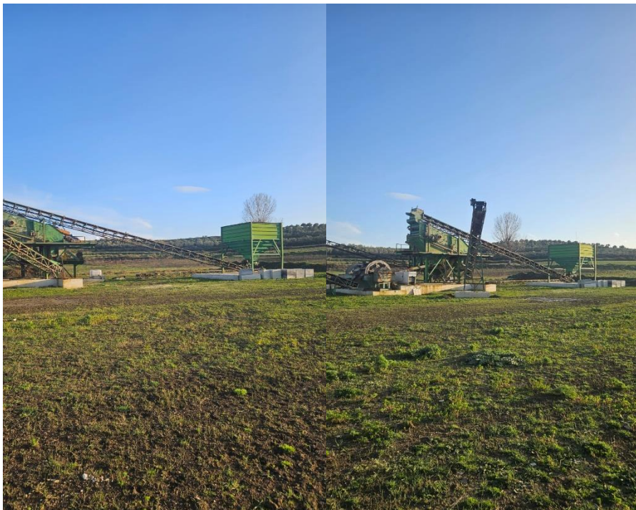
FOTO TE AKTIVITETIT