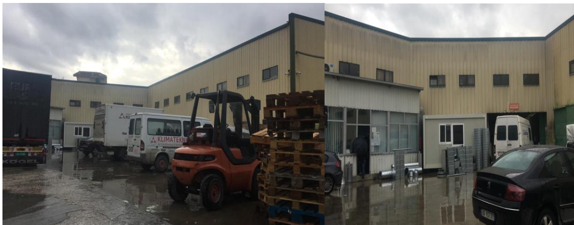
FOTO TE AKTIVITETIT