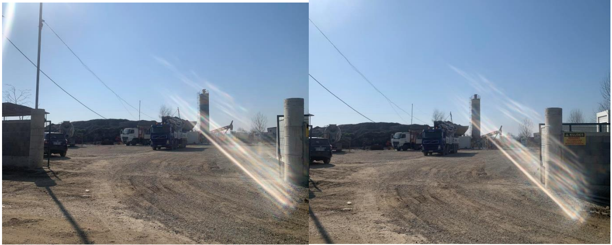
FOTO TE AKTIVITETIT