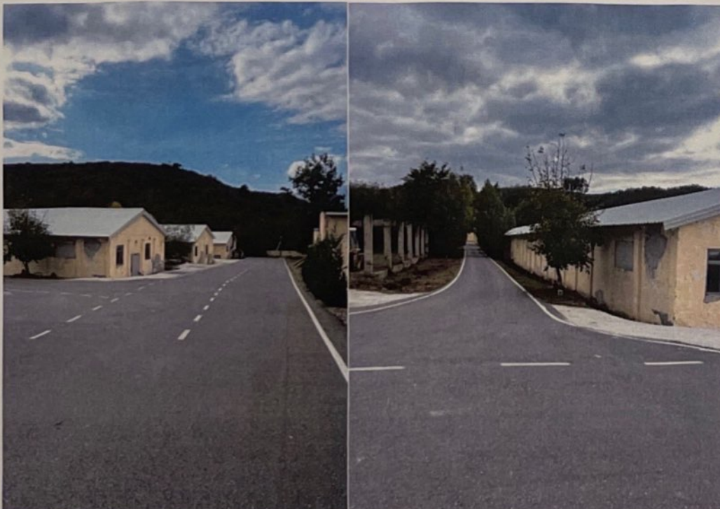
Transportieret e mbetjeve si dhe Ambientet e jashtme te shoqerise Atliu Farm shpk