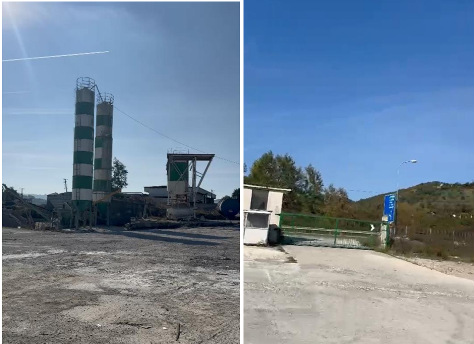
FOTO TE AKTIVITETIT