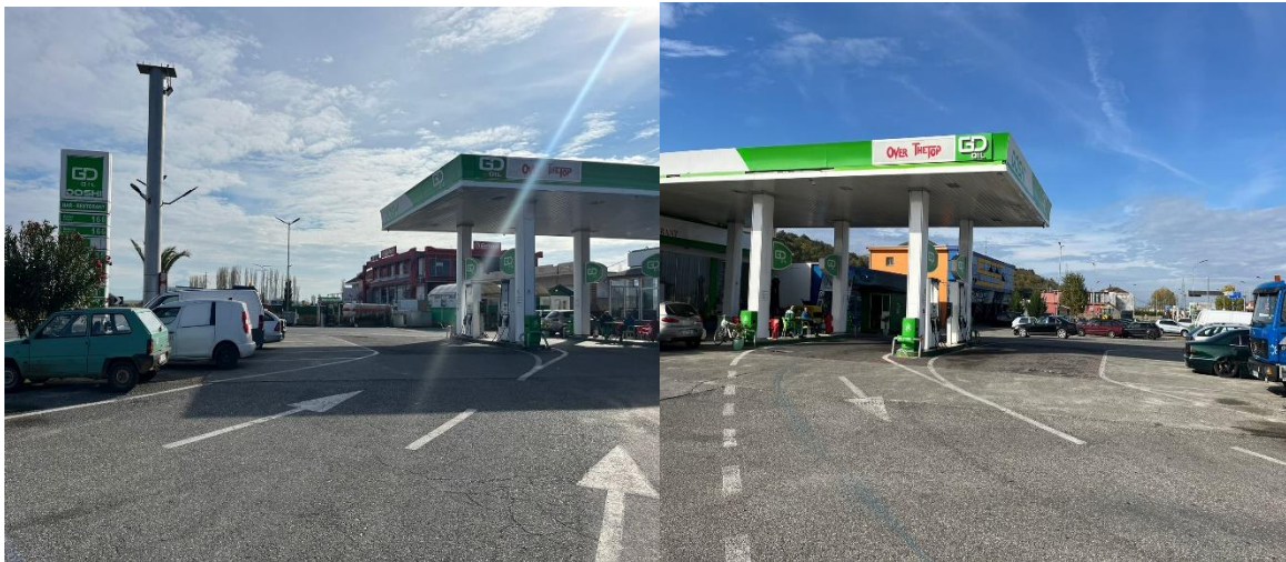
FOTO TE AKTIVITETIT

(Emri, Mbiemri) i nëpunësit të sportelit