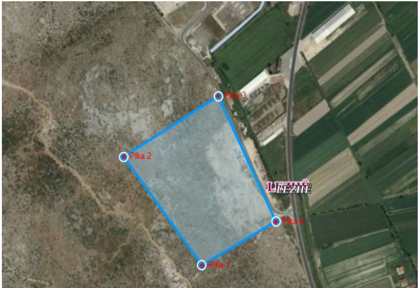
Ortofoto e vendndodhjes së veprimtarisë

Aktiviteti në fjalë ndodhet në brendësi të pronës dhe nuk çënon pronat e tjera përreth. Zona e vendndodhjes së objektit ka infrastrukturë ekzistuese rrugore, rrjetin elektrik etjeter.