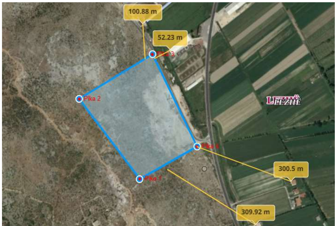
Harta e distancave me objekte te tjera