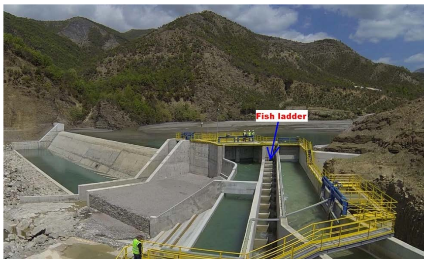
Foto , Shembull e kalimit te peshqve tek vepra e marrjes

Kalimi i Peshqve eshte parashikuar te behet sipas standardeve europiane, ku eshte respektuar menyra e levizjes se peshqve dhe gjithashtu eshte bere ne respektim te ndikimit pamor ne mjedis. Stafi ka verejtur se tipi i perzgjedhur per "fish passage" dhe zbatimi ne objekt I tij eshte ne perputhje te plote me normat dhe kerkesat mjedisore per objekte te tilla. Ne vepren e marrjes do te ndertohet "fish ladder" me beton per nje distance te shkurter ,e cila mendojme se eshte zgjidhje e mjaftueshme ne kete rast dhe me pas me ane te nje "rock ramp – bypass fishway" kalon ne rrjedhen normale ne lumit.