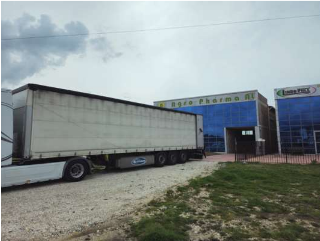
Foto nga magazina e subjektit AgroPharma AL