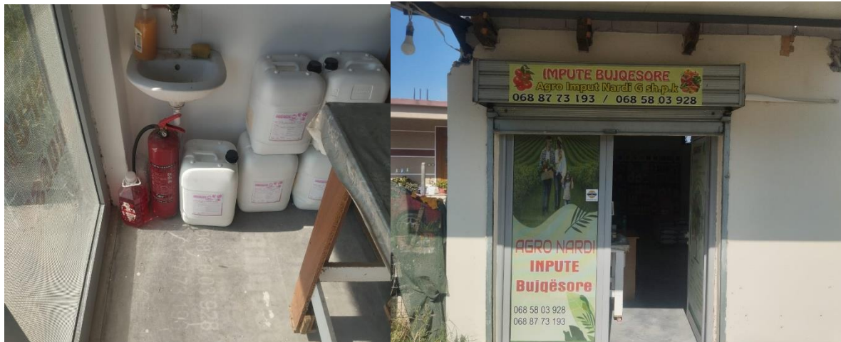
FOTO TE AKTIVITETIT