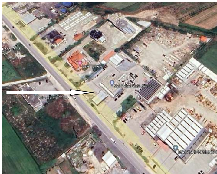
Pamje e vendosjes se aktivitetit