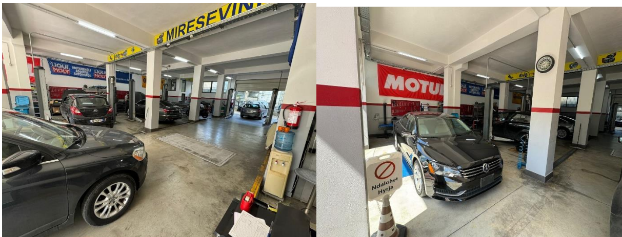
FOTO TE AKTIVITETIT