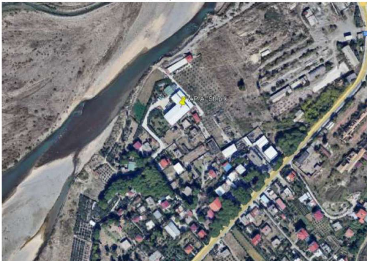
Foto ilustruese te aktivitetit qe zhvillohet