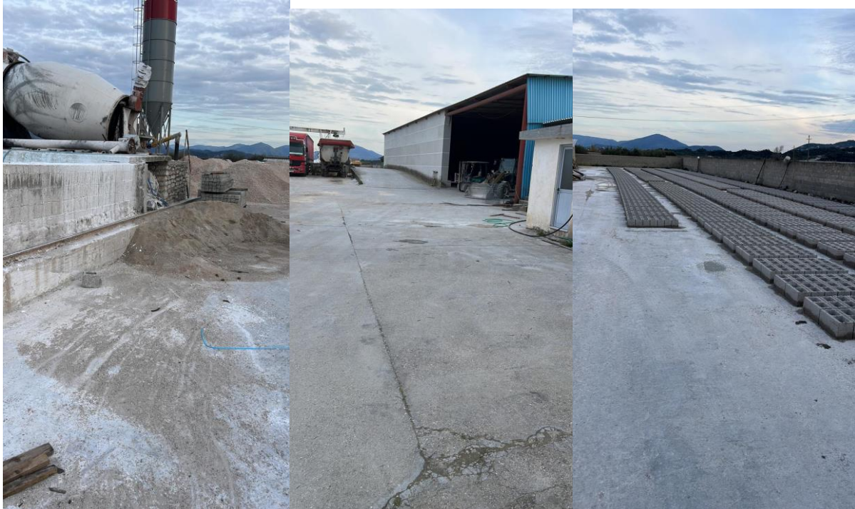
FOTO TE AKTIVITETIT

TEKNOLOGJIA ESHTHE E THJESHTHE DHE TRADICIONALE POR GJITHSESI DUKE PERDORUR MAKINERI TE KOHES DHE CILESORE.