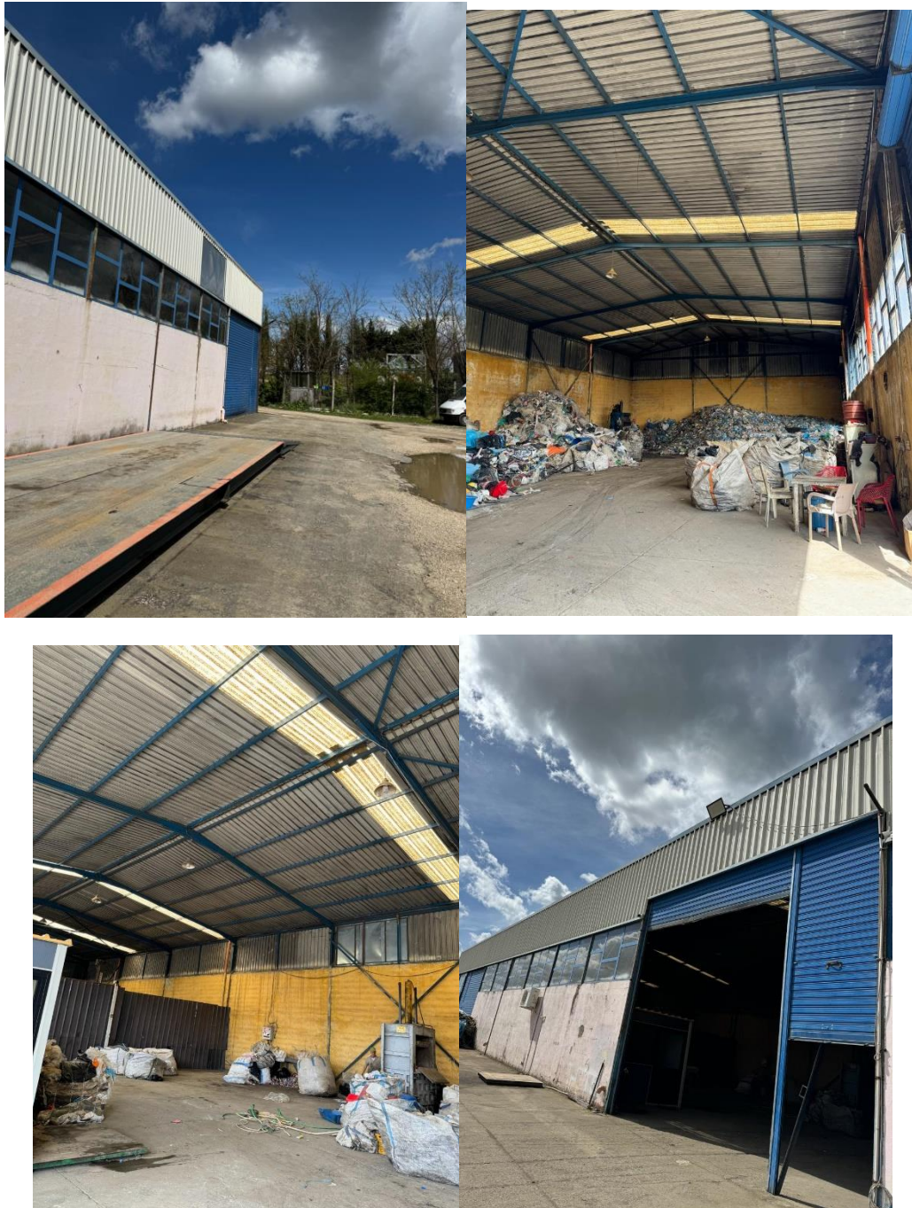
FOTO TE AKTIVITETIT

TEKNOLOGJIA ESHTË E THJESHTË DHE TRADICIONALE POR GJITHSËSI DUKE PËRDORUR MAKINËRI TE KOHËS DHE CILËSORE. MBËTJET RICIKLOHEN OSE GRUMBULLOHEN NE NJË PIKË TE CAKTUAR DHE DERGOHEN NE VENDIN E CAKTUAR NGA BASHKIA.