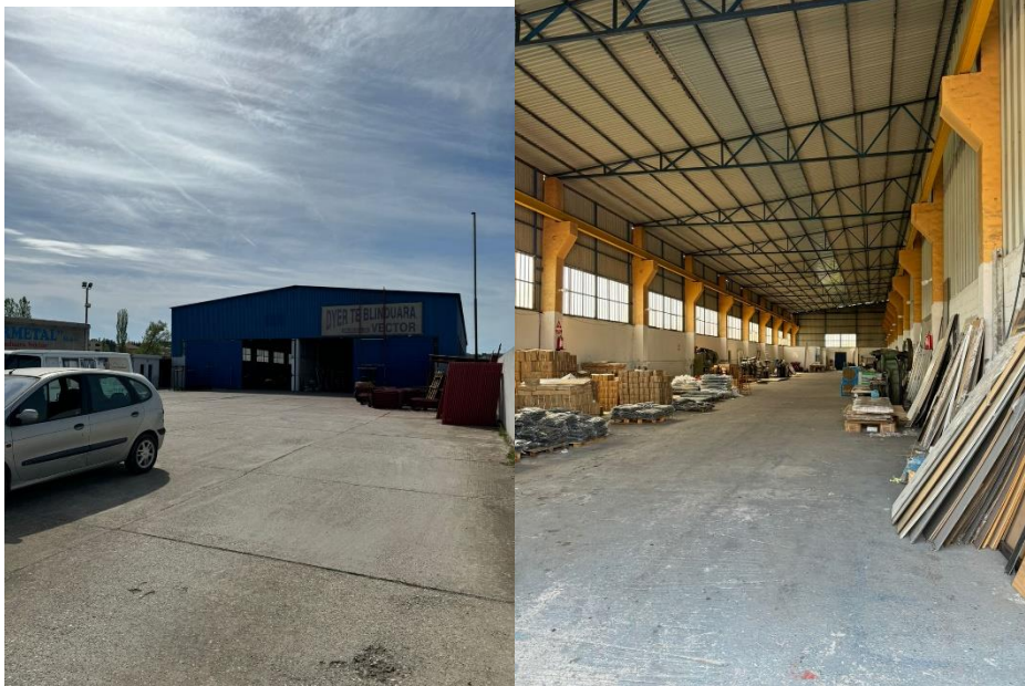
FOTO TE AKTIVITETIT