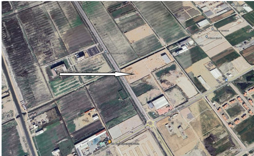
Pamje e vendosjes se aktivitetit

Siperfaqia totale e sheshit ku zhvillohet aktiviteti 3170 m2