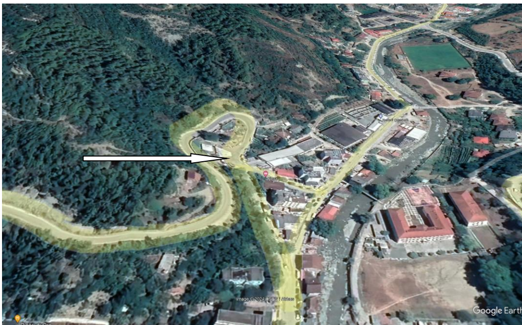
Pamje e vendosjes se aktivitetit

Siperfaqja totale e sheshit ku zhvillohet aktiviteti 146 m2