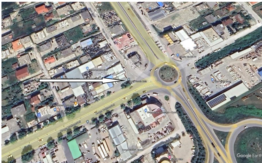
Pamje e vendosjes se aktivitetit

Siperfaqia totale e sheshit ku zhvillohet aktiviteti 2398 m 2