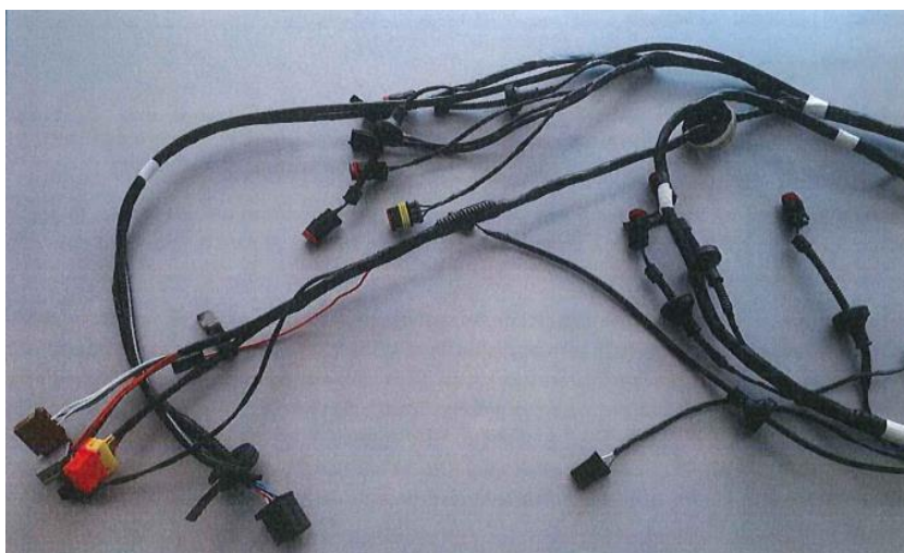
Pamje e produktit të gatshëm

Shkalla e izolimit nuk mund të ndryshohet pa aprovimin paraprak të inxhinierëve të klientit për shkak të pasojave mundshme të izolimit në instalimet e tyre.