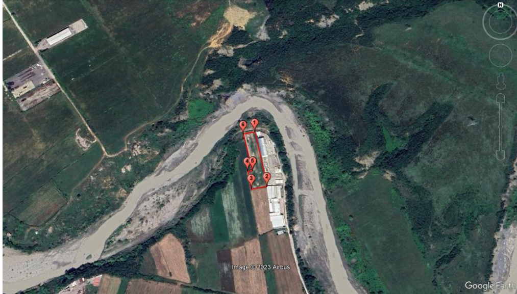
Koordinatat e aktivitetit Gauss-Kruger (Zona 4)