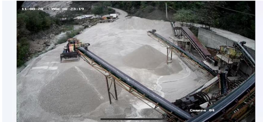
FOTO TE AKTIVITETIT