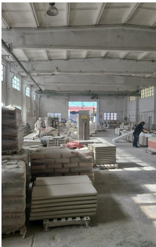
FOTO TE AKTIVITETIT