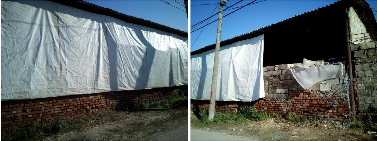
Magazini i bersive per tharje.