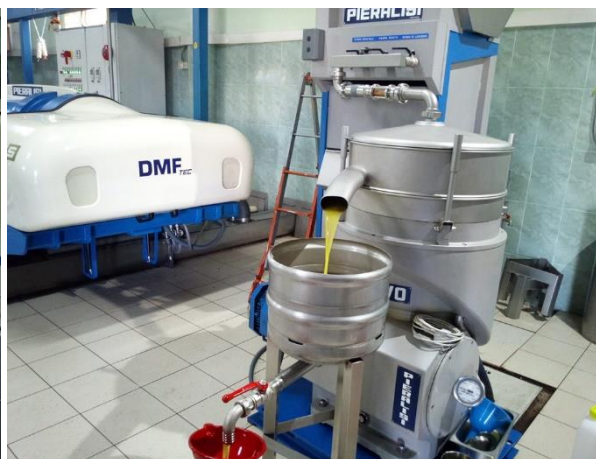
Depozitimi i bersise se dale nga procesi