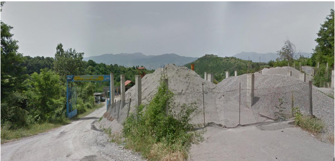
Foto nga aktiviteti ne Melan

Subjekti i cili do te zhvilloj aktivitetin "Impiant per prodhim betoni, asfalto-betoni dhe fraksionim inertesh" eshte "EURALDI" regjistruar prane Qendres Kombetare te Biznesit me date 24.06.1996 dhe themeluar ne daten 14.01.1994 me Nr. NIPTI J66702706K, forma ligjore SHPK. Subjekti do te zhvilloj aktivitetin ne fjale duke qene keto produkte jane mjaft te perdorura ne industrine e ndertimit edhe kerkesat per prodhimin, shtimin e kapacitetit dhe permiresimin e cilesise se markave kane ardhur duke u rritur. Kjo shoqeri do te ushtroi aktivitetin ne Diber Melan MELAN Selia ne objektin me numër pasurie Nr.11, zona kadastrale Nr.2640. ne kete vendodhje ndodhen edhe zyrat e selise se shoqerise EURALDI shpk, i cili ka aplikuar edhe me pare per paisje me Leje Mjedisi Tipi B, per shkak se nuk ehste paisur Brenda vitit me leje Mjedisi subjekti po riaplikon per degjese me publikun ne menyre qe te riaplikoj edhe per leje Mjedisi sipas ligjit ne fuqi.