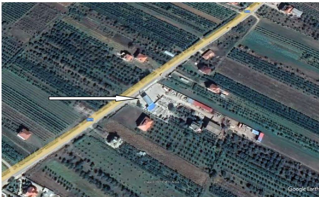
Pamje e vendosjes se aktivitetit

Siperfaqja totale e sheshit ku zhvillohet aktiviteti 30 m2