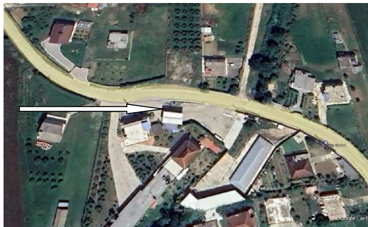
Pamje e vendosjes se aktivitetit

Siperfaqia totale e sheshit ku zhvillohet aktiviteti 100 m 2