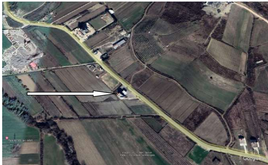
Pamje e vendosjes se aktivitetit

Siperfaqia totale e sheshit ku zhvillohet aktiviteti 1500 m 2