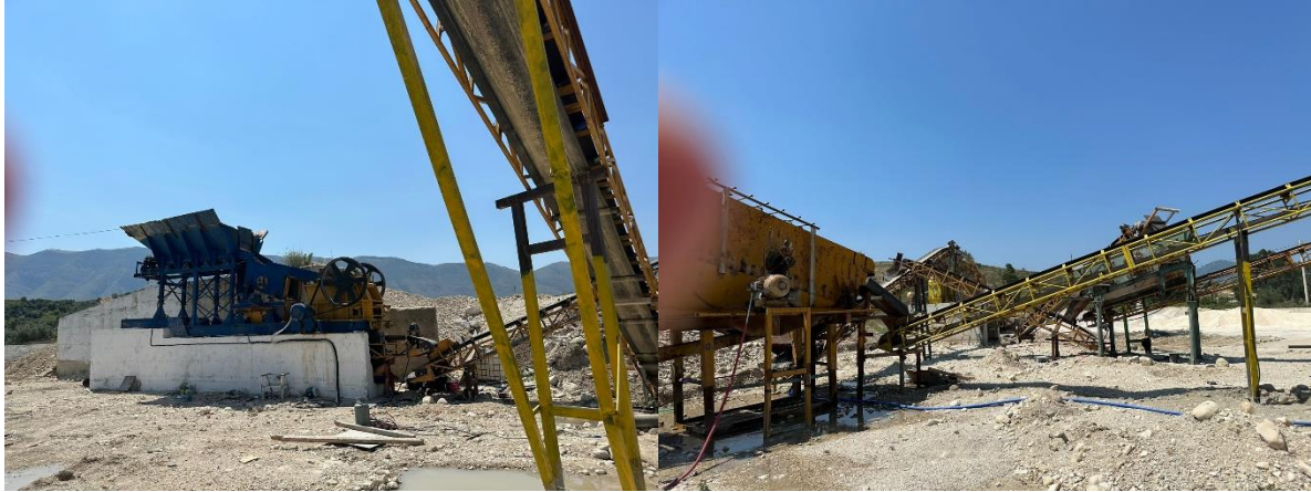
FOTO TE AKTIVITETIT