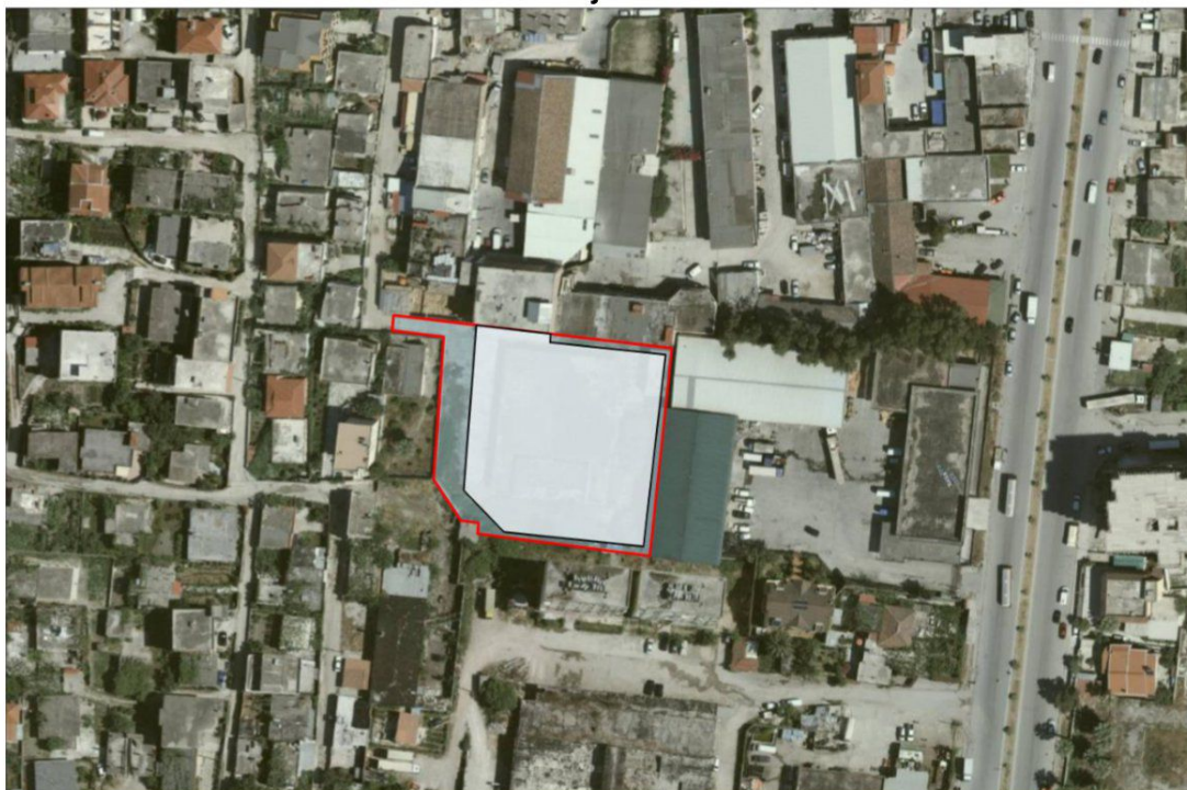
Pozicionimi i objektit në ortofoto

Aktiviteti për prodhimin dhe lyerjen e mobiljeve do të zhvillohet në një objekt ekzistues 2 katesh, i pajisur me leje ndertimi dhe dokumenta pronësie, i ndodhur në Lagjja "Kushtrimi", Rruga "Dëshmorët", Objekt Nr. 5, Vlorë, Vlorë.