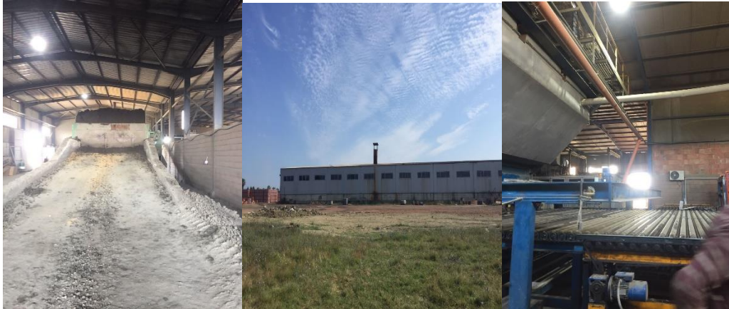
FOTO TE AKTIVITETIT