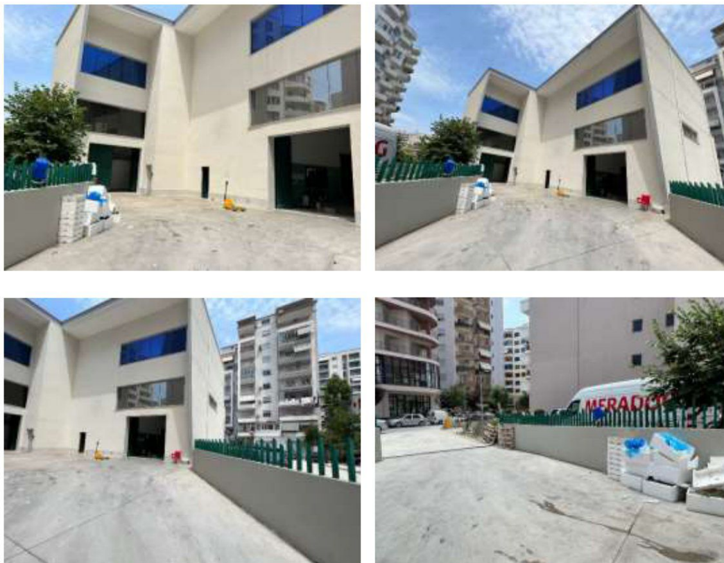
Foto te objektit dhe aktivitetit

Qëllimi i këtij aktiviteti është magazinimi i perkohshem, tregtimin me shumice dhe pakice i peshqe dhe produkteve te detit, duke furnizuar me produkte cilesore tregun vendas.