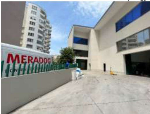
Foto e pergjithshme e zones

Energjia elektrike qe nevojitet per funksionimin e aktivitetit eshte ekzistues dhe merret nga rrjeti kryesor elektrik nËpËrmjet njË matËsi nË pikËn mË tË afËrt tË mundshme. Gjithashtu dhe uji qe nevojitet per funksionimin e aktivitetit eshte ekzistues dhe merret nga rrjeti kryesor nËpËrmjet njË matËsi nË pikËn mË tË afËrt tË mundshme.