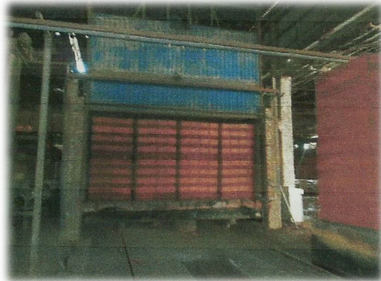
Fig.3 Vagonet e tharjes