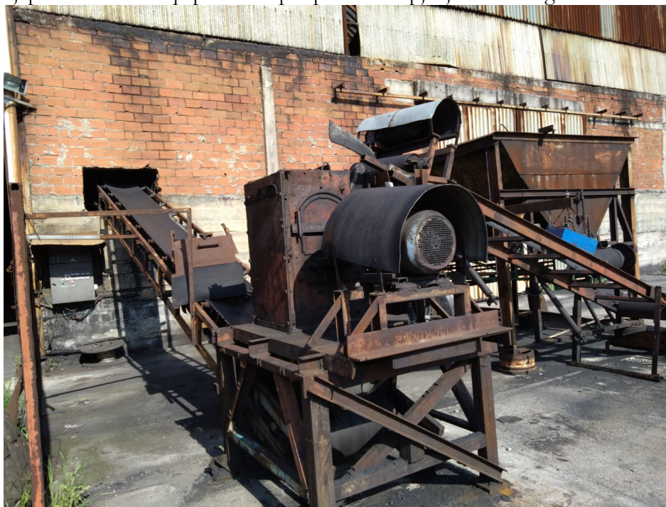
Makineria e bluarjes nr 1.

Faza e katert konsiston ne pjekjen e tullave. Furrat kane gjatesi 120 metra, gjeresi 4.6 metra dhe lartesi 2.3 metra. Kapaciteti maksimal 45 vagona, temperature e pjekjes arrin deri ne 980 grade celcius. Pjekja realizohet me ane te lendes djegese Koks i cili i ushtrohet perpunimit, thermimit dhe tranportohet per ne furra nepermjet impiantit te tubacioneve se bashku me ajrin e paster me ane te ventilatorit. Shkarkimi i gazeve ne atmosfere behet me ane te oxhakut te furrave me lartesi 18 metra. Në fazën e 4 të procesit të pjekjes së tullave bashkë me qymyrin koks mund te perdoren edhe lende të tjera alternative (mbetje) ne nje sasi per rreth 5 ton ne dite ne varesi te fuqise kalorifike te seciles lende alternative mbetje qe do te perdoret. Ky process fillon qe nga procesi I bluarjes dhe perzierjes se lendes alternative mbetje me qymyrin koks. Pas procesit te bluarjes deri ne forme pluhuri (pudre) presohet me ane te ventilatoreve se bashku me ajer ne impianti qe ndodhet mbi furren e pjekjes dhe me pas injektohet ne furrat e pjekjes. Temperatura ne furren e pjekjes arrin 950 – 980 grade celcius ne varesi te llojit te tullave qe do te piqen. Me poshte po japim makinerite qe perdoren per procesin e pjekjes me fotografi.