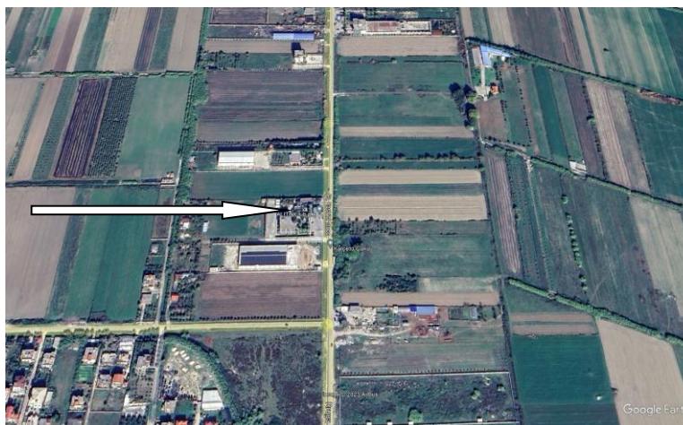
Pamje e vendosjes se aktivitetit

Siperfaqia totale e sheshit ku zhvillohet aktiviteti 193m 2