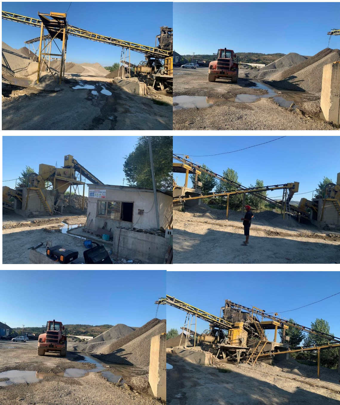
FOTO TE AKTIVITETIT

TEKNOLOGJIA ESHTË E THJESHTË DHE TRADICIONALE POR GJITHSËSI DUKE PËRDORUR MAKINËRI TE KOHËS DHE CILËSORE.