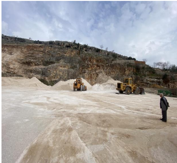
FOTO TE AKTIVITETIT