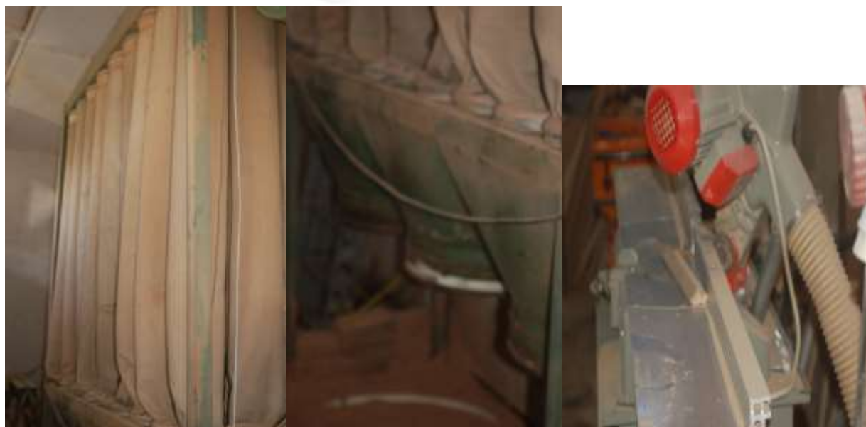
Filtri me mëngëshkakim i tallashit ngamëngët tubi aspirimit në një pajisje

Në pajisjet teknologjike ku bëhet sharrimi, zmerilimi apo pastrimi i sipërfaqeve, janë të pajisura me tubaconet e aspirimit të tallashit që krijohet gjatë zhvillimit të këtyre proceseve. Në hapsirat e ambienteve të punës të kësaj veprimtarije gjenden të vendosur gjithashtu tuba të lirë të sistemit të aspirimit të ajrit. Këto tuba "të lirë" bëjnë të mundur shërbimin e aspirimit, të të gjithë hapsirave të punës.