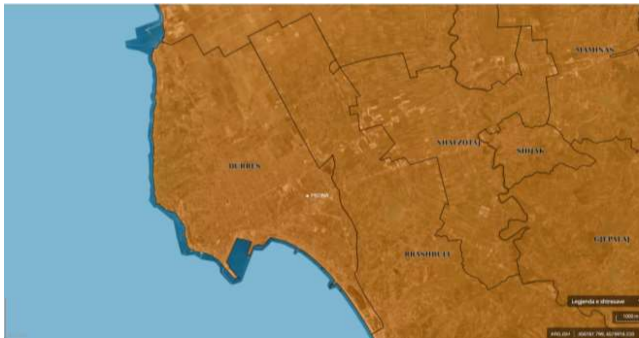
Pozicioni I zones se aktivitetit ne lidhje me ndarjen administrative

Vendodhja e aktivitetit “Pastrim Kimik Durres, Durres, DURRES, Lagjja nr.14, Shkozet, objekt me nr. pasurie 3/76/ND, zona kadastrale 8515.