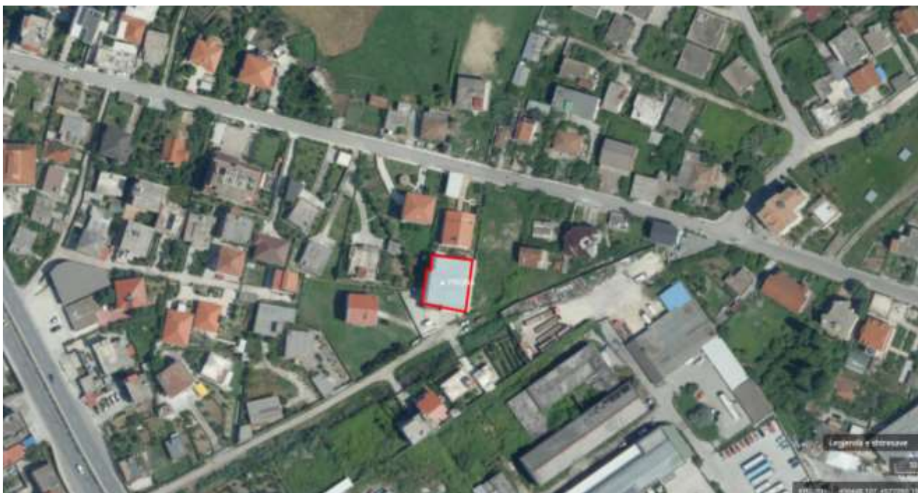
Ortofoto e zones se aktivitetit

Aktiviteti Pastrim kimik, do te zhvillohet ne adresën: Durres, Durres, DURRES, Lagjja nr.14, Shkozet, objekt me nr.pasurie 3/76/ND, zona kadastrale 8515.