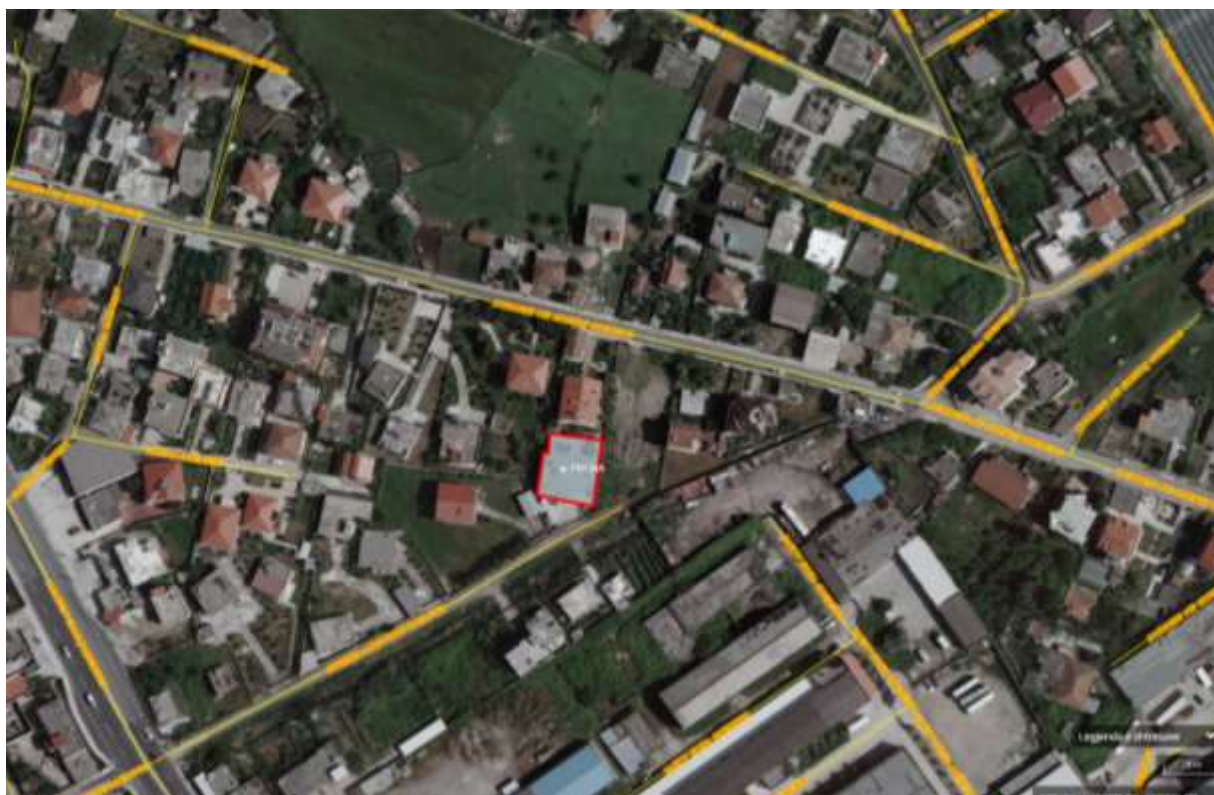
Pozicioni I zones se aktivitetit ne lidhje me rrjetin rrugore