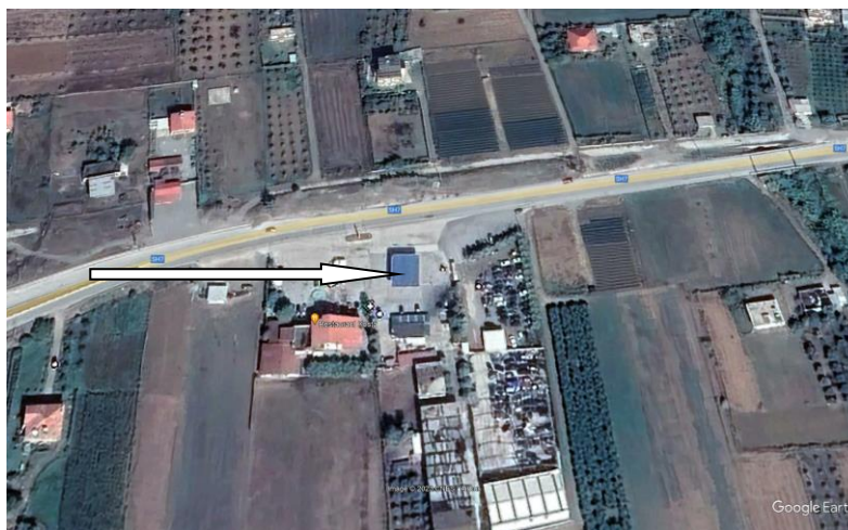
Pamje e vendosjes se aktivitetit

Siperfaqia totale ku zhvillohet aktiviteti 155 m2