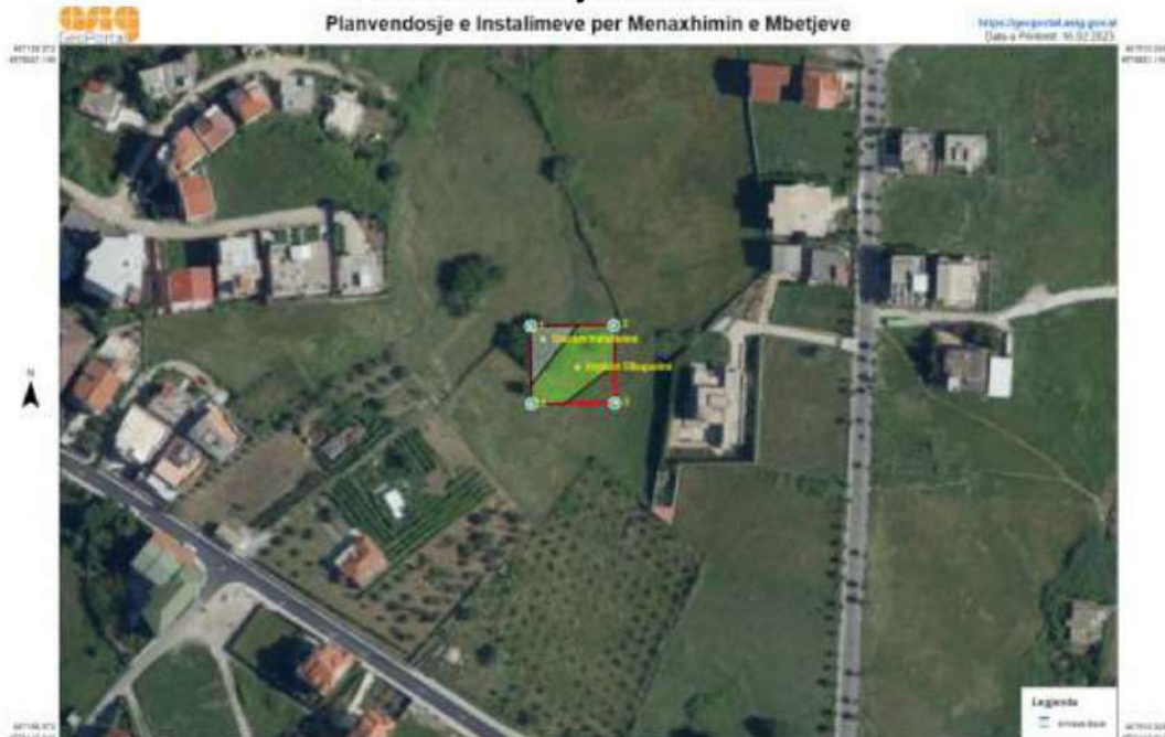
Planvendosje e Instalimeve per Menaxhimin e Mbetjeve