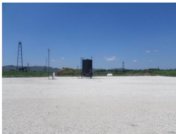
Pamja nga sheshi

Objektivi i dyte i ketij aktiviteti eshte gjetja e alternativave qe jane me miqesore me mjedisin. Shfrytëzimi i burimeve natyrore të naftës do të kryhet duke përdorur shpimet vertikal ekzistuese dhe shpimet horizontal me praktikat konvencionale fillestare të prodhimit. Sherwood ka të drejtë për të shitur naftë në Shqipëri si dhe rezervon të drejtën për të eksportuar hidrokarbure nga vendburimi i Kuçovës. Rezervat e hidrokarbureve në vendburimin e Kuçovës u zbuluan nga Italianët para Luftës së Dytë Botërore dhe më vonë u shfrytëzuan nga operatori i vetëm shtetëror “Albpetrol” nga viti 1945. Subjekti Sherwood qe nga viti 2004 ka pasur koncesionin e zhvillimit dhe prodhimit ne kete vendburim. Kuçova njihet për burime natyrore të naftës dhe shfrytëzimi i tyre në këtë rajon ka filluara dekada më parë. Kjo pasuri natyrore ka qënë dhe mbetet një nga degët kryesore të ekonomise së këtij rajoni. Dëshira dhe mundësia për tu punësuar në këtë sektor ka bërë që të vendosen familje nga rrethe të ndryshme të vendit. Si rezultat përreth burimeve janë të vendosura qendra banimi. Për të mbështetur këtë prodhim ekzistues, Sherwood planifikon shpimin e puseve për prodhimin e hidrokarbureve nga formacionet, si dhe puset për prodhimin e ujit dhe për injeksion e ujërave të ndotura