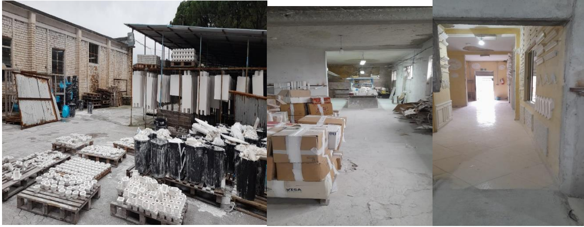
FOTO TE AKTIVITETIT