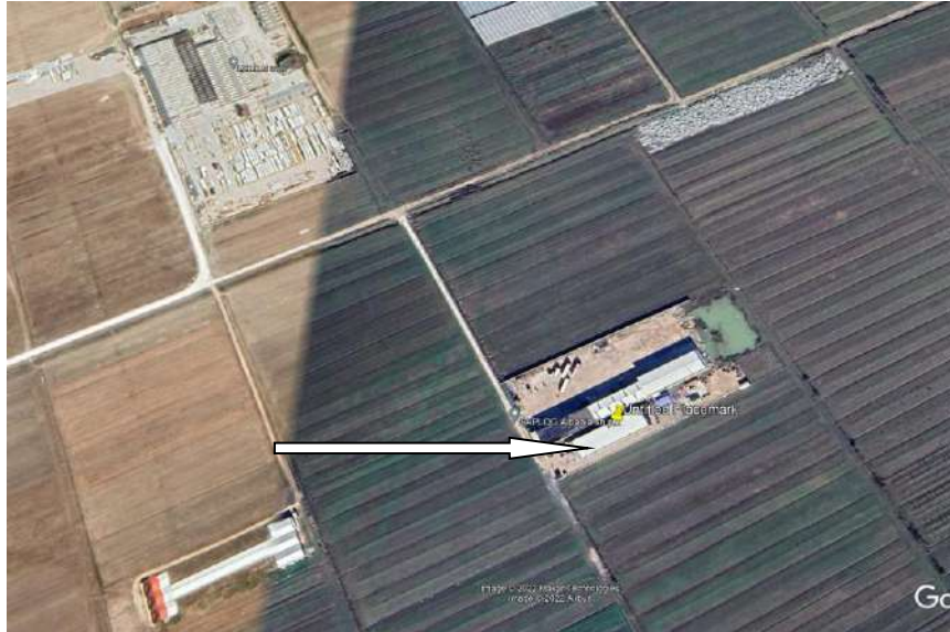
Pamje e vendosjes se aktivitetit

Siperfaqia totale e truallit ku zhvillohet aktiviteti 5220 m2,