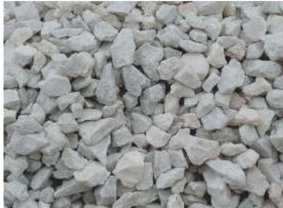
agregat i grimcuar i shkëmbinjve gëlqeror