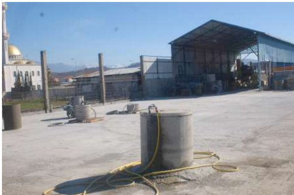
Pusi i ujit.

Aditivët paraqesin shtesa të veçanta me të cilat mund të përmirësohen disa veti të betonit të freskët dhe të ngurtësuar siç janë përpunueshmëria, vendosshmëria-shtruarja e betonit, pa depërtueshmëria e ujit etj.