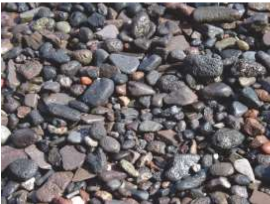
rërë, çakall dhe grimca / kokrra

Agregati i grimcuar, fitohet me grimcimin e shkëmbinjve natyror të fortë prej cilësdo prejardhje. Kokrrat e agregatit të grimcuar janë me tehet të mprehta çka mundëson inkastrim të tyre më të mirë dhe kjo kontribuon për përmirësimin e disa karakteristikave mekanike të betonit. Vetë e volitshme e agregatit të grimcuar është edhe homogjeniteti petrografik i tij çka kontribuon që t'i shmangët ose zvogëlohet konçentrimi i sforcimeve në beton nga veprimi i ngarkesave ose ndryshimeve të temperaturave.