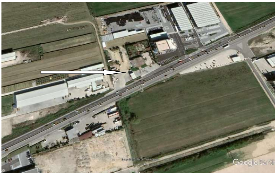
Pamje e vendosjes se aktivitetit

Siperfaqia totale e sheshit ku zhvillohet aktiviteti 2929 m2